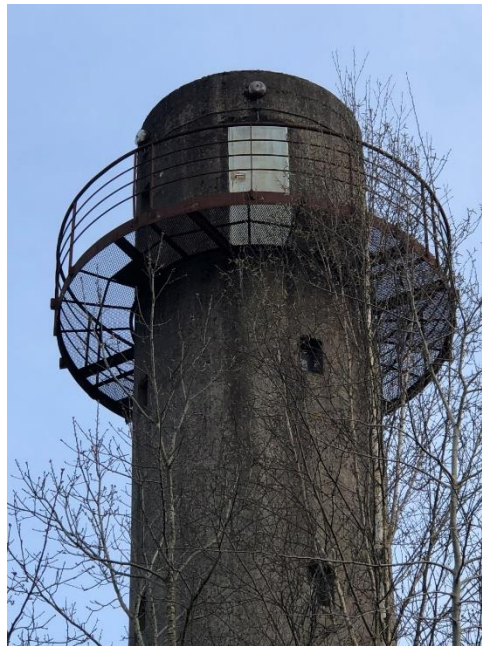
Tour de Nançay en 2023

https://appel.nasa.gov/2010/08/12/aa_3-8_f_history-html/