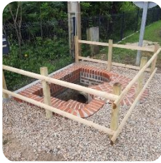
La Source St Bernard, route de Vierzon

Les enfouissements de la route de Salbris se déroulent dans de bonnes conditions, le timing est respecté. Le projet d'aménagement de la route de Salbris et du Centre Bourg est en cours d'étude, nous le présenterons au cours d'une réunion publique.