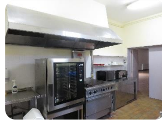
Réaménagement de la cuisine de la salle Polyvalente Peinture et nouveau matériel plus performant (cuisson à vapeur, lave-vaisselle, réfrigérateur)