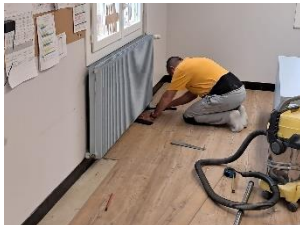
Changement sol Classe de CE2-CM1