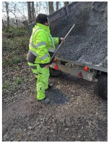
Bouchage des trous dans les chemins