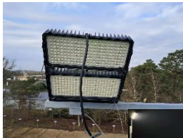
Eclairage stade de foot