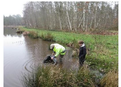
Empoisonnement Étang de la Chaux